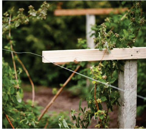
Billede: Hindbaer opbinding.jpg