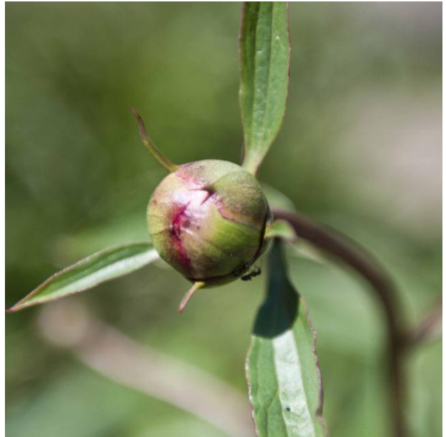
Billede: Paeonia myrer.jpg